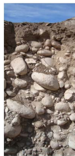
San Pablo Paraje Altamira 1150 – 1500 m 1050 – 1150 m 3770 – 4760 ft 3440 – 3770 ft