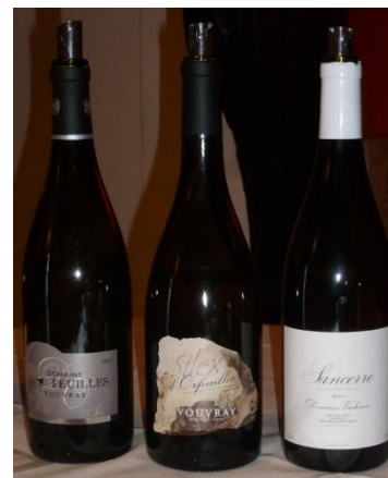
Der Sancerre der Domaine Vacheron wurde am gleichen Tisch wie zwei weitere interessante Erzeugnissen des Loire-Gebiet ausgeschenkt.

Paul Liversedge bietet eine sehr gute Auswahl internationaler Weissweine an, welche auch ein paar Trouvaillen umfasst. Der klassische Sancerre blanc 2011 der (in der Schweiz) noch verkannten Domaine Vacheron bekräftigt unsere Meinung, dass es neben den üblichen weissen Chardonnay aus dem Burgund oder Sauvignon Blanc aus Bordeaux noch Platz für ein drittes französisches Anbaugebiet gibt. Während noch zu viele Weinliebhaber es (hoffentlich unbewusst) ablehnen, sich für die Erzeugnisse der Loire zu interessieren, beweist uns die Domaine Vacheron mit diesem Sancerre, wie gross die Appellation sein kann. Es handelt sich hier gewiss nicht um die Tat eines Terroiristen, wie es die Cousins Cottat sind. Dennoch bietet dieser Wein unendlich viel Spass und einen sofort erkennbaren Charakter. Mineralität (Feuerstein) und Zitrusfrucht strömen elegant aus dem Glas. Der Antrunk zeigt sich sehr trocken und subtil, zart und frisch, was sich im Gaumen bestätigt. Tolle Säure und ein köstlicher Abgang. 17/20.