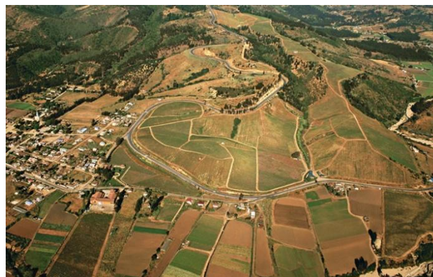
Das San Antonio Tal

Die vor kurzem fertiggestellte winery im Rosario Valley ist in jeder Hinsicht state-of-the art . Pumpen sind überflüssig. Umfüllen des Mostes und der Weine geschieht ausschliesslich mit Schwerkraft. Alle Stahltanks (Kapazität bis zu 300'000 Liter) sind Temperaturkontrolliert. Matetic ist in Chile übrigens mit seinen 120ha unter Reben ein kleiner Weinproduzent.